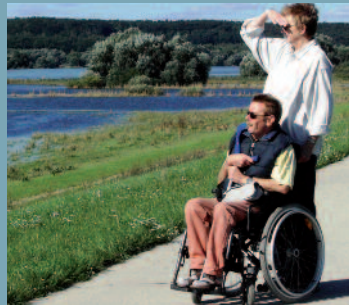
Dank unserer nationalen und internationalen Hilfe können sie zuversichtlicher in ihre Zukunft schauen. links: DREAM in Mosambik mitte: Wohnprojekt in Essen, rechts: Gruppenreise der Aidshilfe Frankfurt